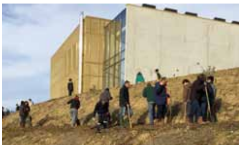
Aménagement du talus du parking de l'Escal

Le 9 décembre dernier un grand chantier participatif a rassemblé de nombreux bénévoles de l'association, les services techniques de la Mairie avec la participation exceptionnelle des scouts de Limoux.