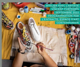
ATELIER AVEC L'ARTISTE VINCENT FORTEMPS SEPTEMBRE 2022 PROGRAMMATION PAR L'ENTRACTE, ESPACE D'ART CONTEMPORAIN