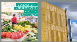
L'ÉVÈNEMENT « SENTEZ-VOUS SPORT ? » SEPT. 2022