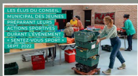
LES ÉLUS DU CONSEIL MUNICIPAL DES JEUNES PRÉPARANT LEURS ACTIONS SPORTIVES DURANT L'ÉVÈNEMENT « SENTEZ-VOUS SPORT ? » SEPT. 2022