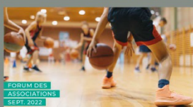
FORUM DES ASSOCIATIONS SEPT. 2022