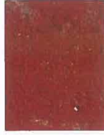
tuile ocre rouge