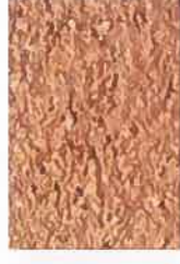
T ocre rose 2520-Y40R