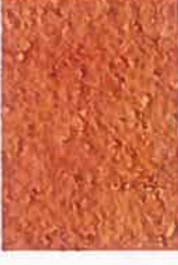
T rouge brique 2040-Y60R