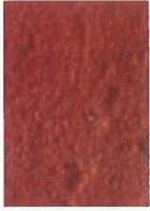
brique moulée rose