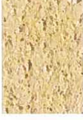
T jaune 1030-Y15R