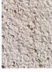
T beige 2010-Y20R