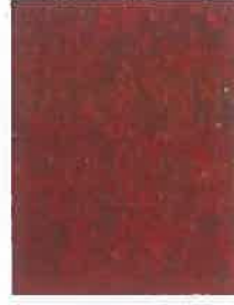
tuile rouge vieillie