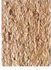
T terre 2020-Y25R