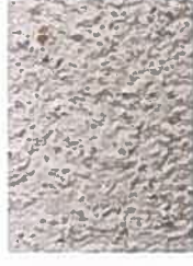
T beige clair 1005-Y20R