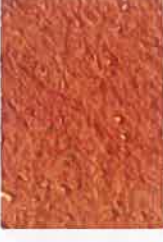
T rouge foncé 4030-Y50R

Ces teintes peuvent s'appliquer sur les façades d'immeubles à peindre. Les références proviennent du Natural Color System (NCS).