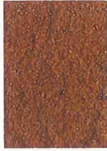
brique moulée paille