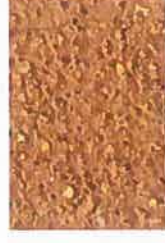
T ocre orangé 3030-Y30R