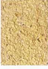
T paille 2030-Y10R