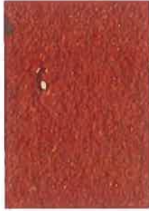
brique moulée orangée