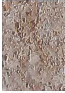
grès de Furne