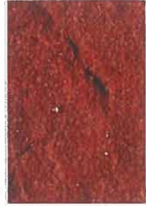
brique moulée rouge