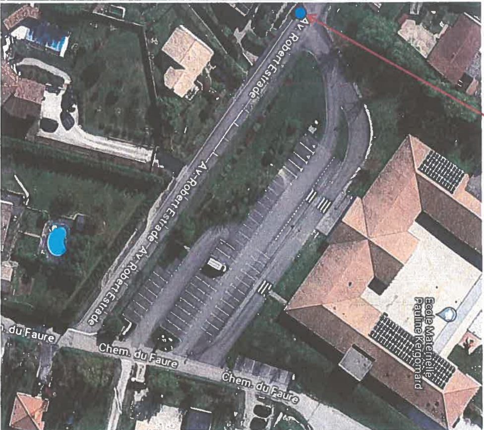
DEBUT DE ZONE DE RENCONTRE + D'ARRIERE

SAUF VELO SENS INTERDIT ET FIN DE ZONE DE RENCONTRE + D'ARRIERE