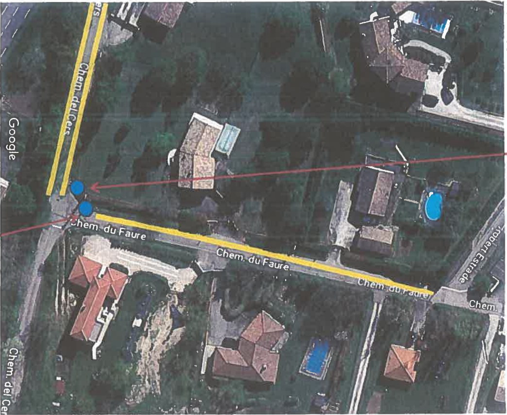
Début de VOIE PARTAGEE + PP