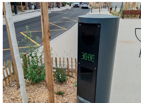
Zones minutées rue de la République