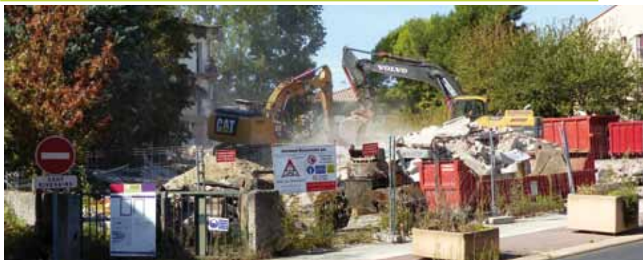
L'ancienne gendarmerie en cours de démolition

Vous pouvez maintenant voir l'espace dégagé de l'ancienne gendarmerie qui laissera bientôt la place au projet "Le Cocagne" réalisé par Cité Jardins (voir Nailloux N° 8 page 7).