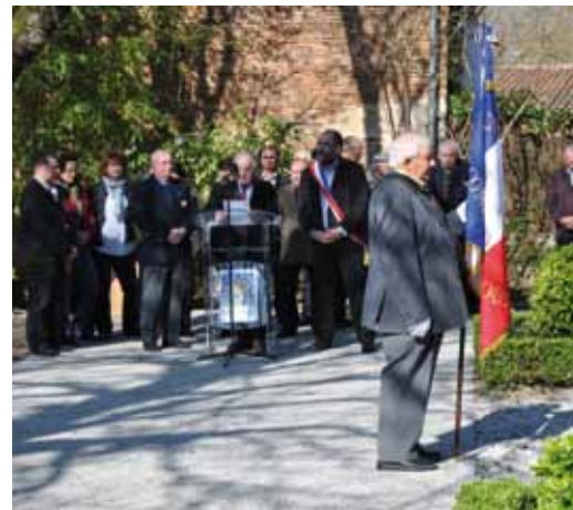
Le devoir de mémoire est précieux..préservons le...

RÉUNION PUBLIQUE MERCREDI 6 DÉCEMBRE À 19H00 SALLE JEAN JAURÈS