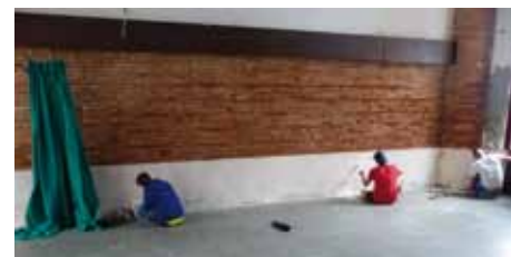
Les jeunes affectés aux services techniques repeignent la Halle