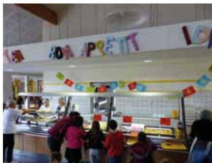
Nouveau : Multi-choix pour le self de l'école élémentaire sur les entrées, les accompagnements, les produits laitiers et les desserts.

Verdict des élèves qui nous ont livré leurs impressions : "C'est meilleur parce qu'il y a plus de choix, que l'on mange bio, et différemment des autres années. Maintenant on espère juste avoir des glaces en dessert un jour. Vous pourrez leur demander ?" Au vu des assiettes vides à la fin du repas... Le nouveau prestataire a tout bon !